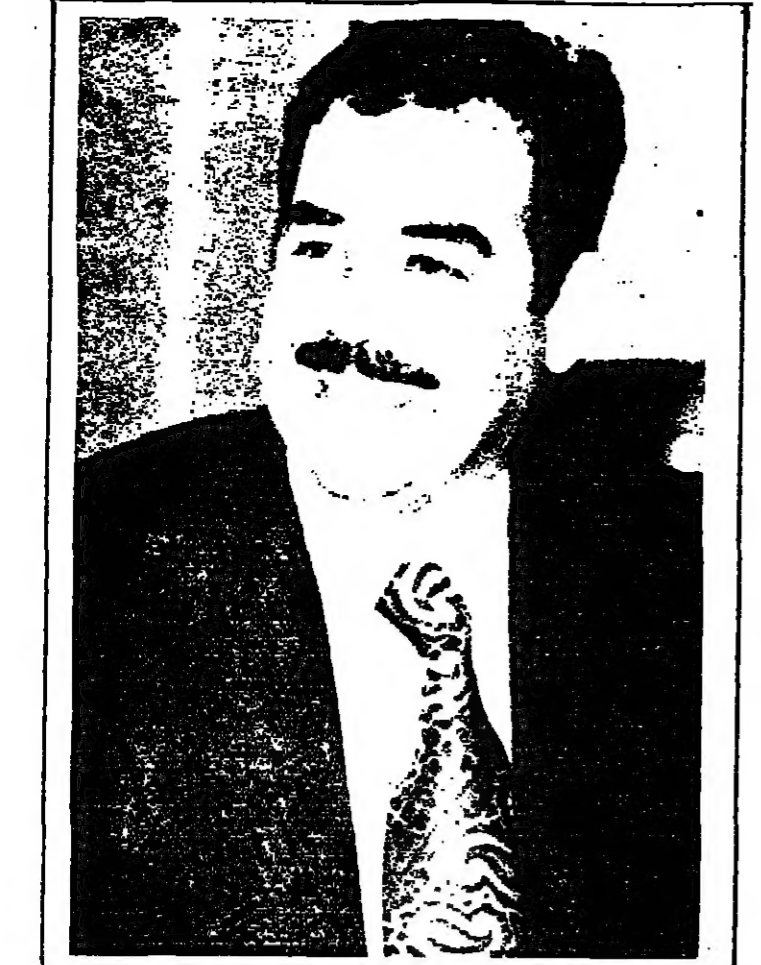
شمعي في جنوب العراق، لقد اوقف الشاه فتيده للكراد عندما شعر بان الجيش الايراني بدأ يحارب العراق بدلاً من الكراد انفسهم، ولكن الشاه كان ضعيف الارادة، بينما يسم صدام بصلاصة موافقه، وان يكن خراً. ان مزايما

وقد رفض طلب اسرائيل هذا للاتحاق بعضوية المنظمة الدولية بيوذاك لكونه المستحيل كان لا يزال غامضاً. فشدت غزت الدول العموية اسرائيل بجيوشها، وكانت رضى الحرب لا تزال تدور، ولم تكن قد بدأت بعد مفاوضات الهدنة التي طالب بها مجلس الأمن الدولي. من هنا فقد جددت اسرائيل طلبها للاتحاق بعضوية الأمم المتحدة في نفس اليوم الذي ابرمت فيه اتفاقية الهدنة مع مصر في 24 ايار 1949. وقد استعملت الحكومة المؤقتة في اسرائيل بحكومة عربية علسى اساس نتائج اول انتخابات عامة تمت في البلاد «الخامس والعشرون من يناير 1949». من هنا، ولما كان القابل قد انتهى، واتفاقيات الهدنة قد وقست، وانتخابات ديمقراطية عامة قد اجريت، وحكومة عابدة قد تشكلت - فقد اصبحت